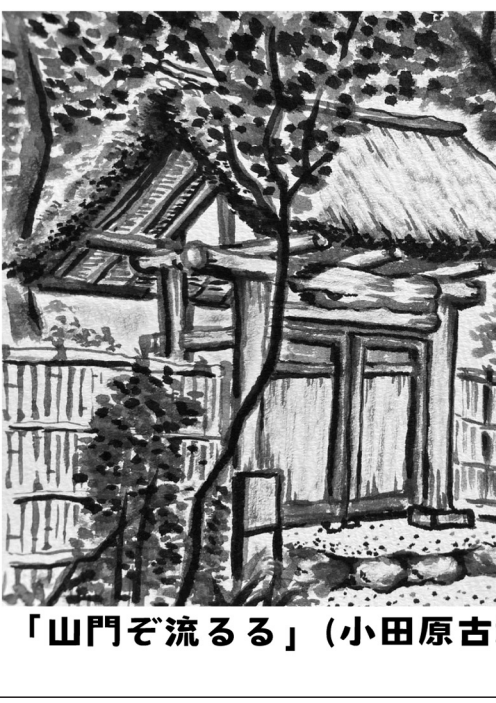
「山門ぞ流るる」(小田原古稀庵/小田原市)

「小田原まち歩き」に参加して、初めて知った。ずっと住んでいても知らなかった時代背景と素敵な場所、まだまだありそう。楽しみ。